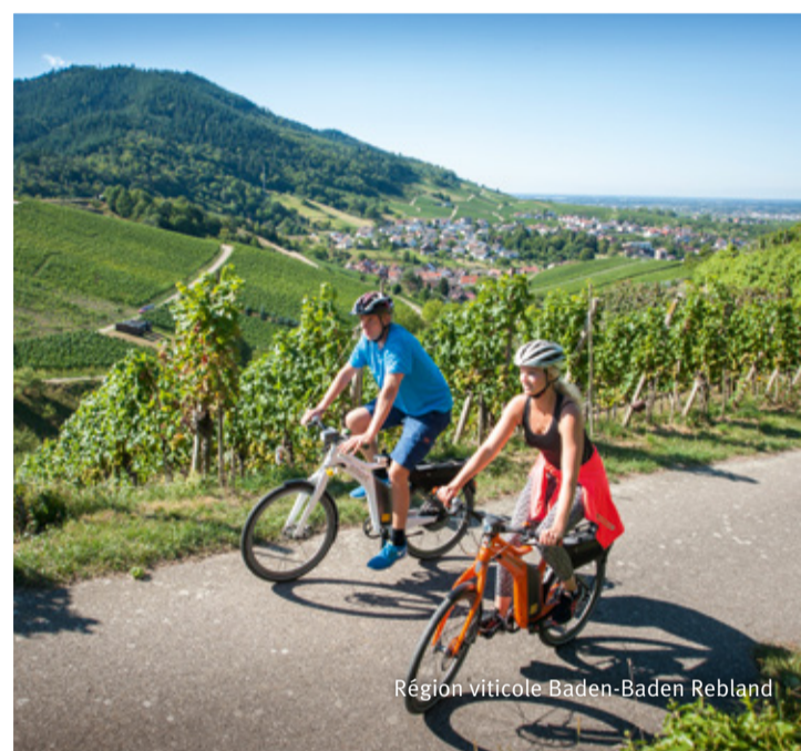
Région viticole Baden-Baden Rebland